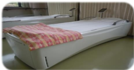
ウォーターベッド

5段階の強弱の設定ができ、水圧で下から全身を優しくマッサージし、皆様に大変ご好評頂いております。別途料金等はいただきません。