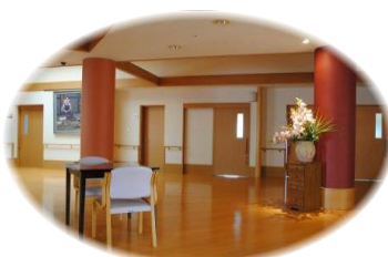
共有フロア(さくら)