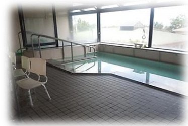
富士山の見える大浴場