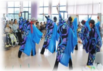
ボランティア様による 誕生会での余興