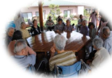
中庭・東屋にてお茶会