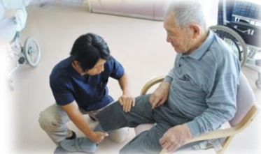
柔道整復師による個別訓練