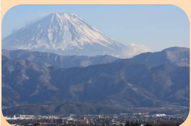
めぐみ荘からの霊峰富士