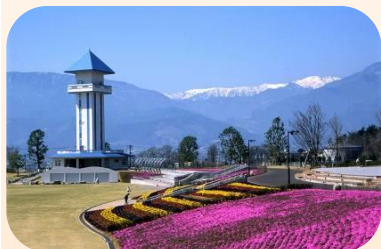
ドラゴンパーク (赤坂台総合公園)