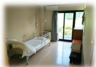
居室(ユニット型準個室)

ユニット型個室 53名 (つつじ10名 もくせい10名 琥珀14名 さくら19名) ユニット型個室的多床室(旧ユニット型準個室) 20名 (あじさい10名 もみじ10名)