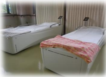
ウォーターベッドマッサージ