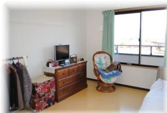
居室(ユニット型個室)