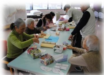
季節に合わせた工作