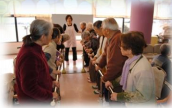
グループに分かれて行う訓練