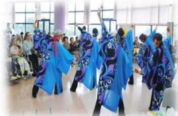
ボランティア様による 誕生会での余興