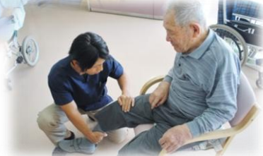
柔道整復師による個別訓練