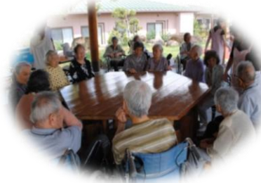
中庭・東屋にてお茶会