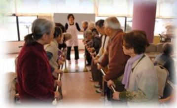
グループに分かれて行う訓練