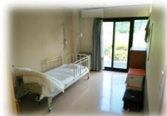
居室(ユニット型準個室)

ユニット型個室 53名 (つつじ 10名 もくせい 10名 琥珀 14名 さくら 19名 ) ユニット型個室的多床室(旧ユニット型準個室) 20名 (あじさい 10名 もみじ 10名 )